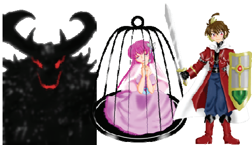
図 1 登場人物(左より魔王スタレール, シュタット姫, 勇者アルト)

続いて、当該地域に地域資源を配した地図と地域資源への行き先について暗示させる課題を記述した冊子を作製する。これは、人間の好奇心やチャレンジへの熟達志向性にはたらきかける要素を採り入れる(図 2)。