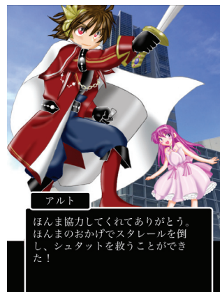
図 3 WEB スクリーンショット

以上のように、ハイブリッドまちあるきは地域資源を要素に物語化し、ゲームフィクションを採り入れ地域資源を探索する。それにより、地域資源の新たな価値創造やコミュニティの創出が可能であり、参加者が主体的に地域に対し行動変容を促進することが可能となる。そして、一般化が容易なまちあるきである。