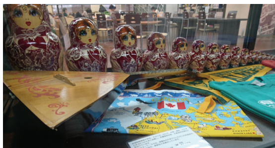
図 4 地域資源の出題例